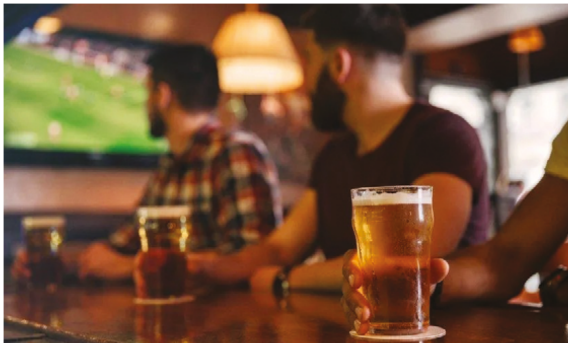
Movimento reduzido influenciou para que 29% das empresas relatassem perdas no mês de janeiro deste ano

"O período parecia mais positivo para o faturamento, mas essa expectativa não se concretizou. Na verdade, vejo que foi até um pouco pior que nos outros anos. Vimos a taxa de desemprego em um patamar