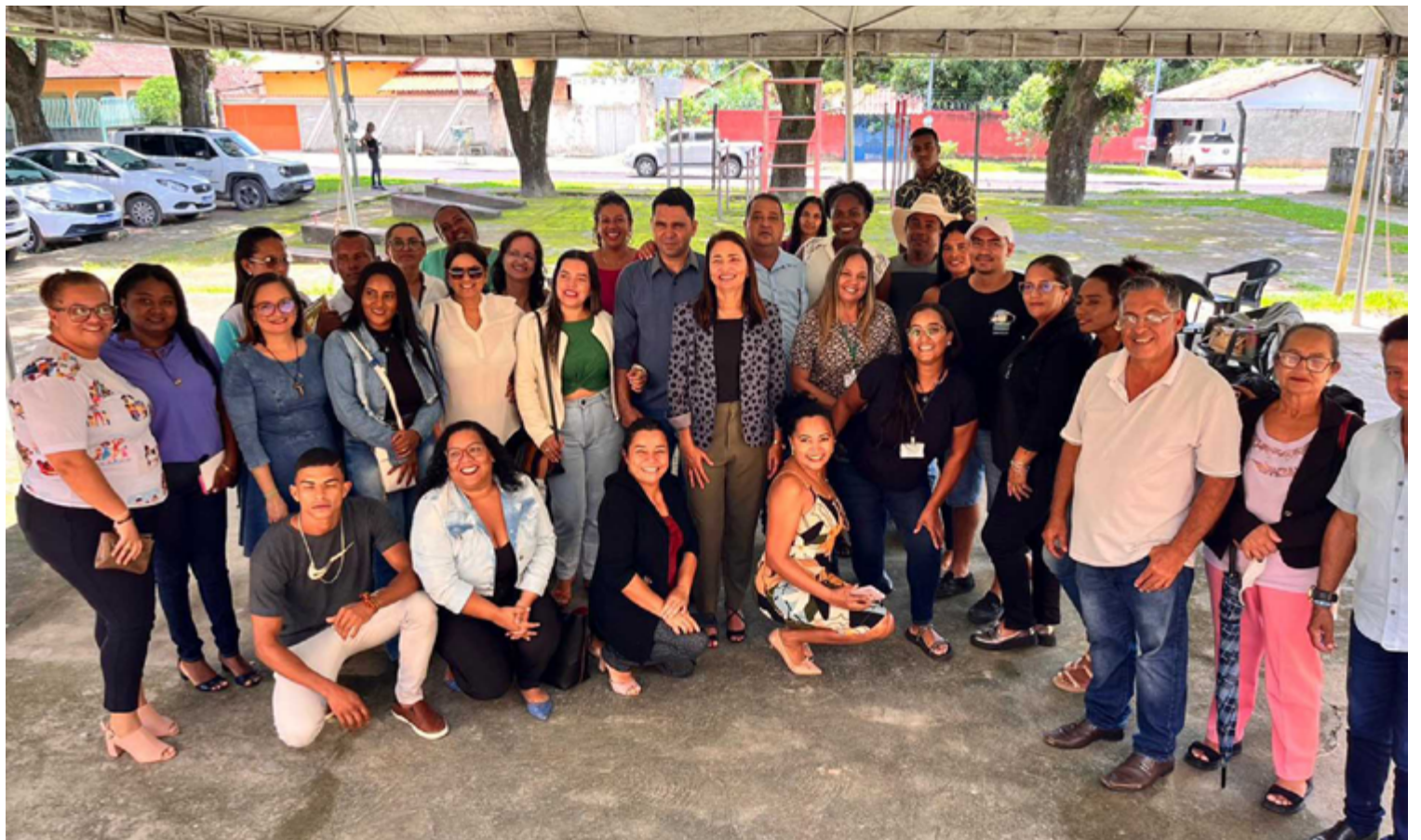
O evento aconteceu na última quarta-feira (13) na Academia do Idoso, em Teresina de Goiás

O evento, que teve início na quarta-feira (13), teve duração de dois dias, encerrando nesta quinta-feira (14) contou com a colaboração da Secretaria de Assistência Social local e do município de Teresina de Goiás.