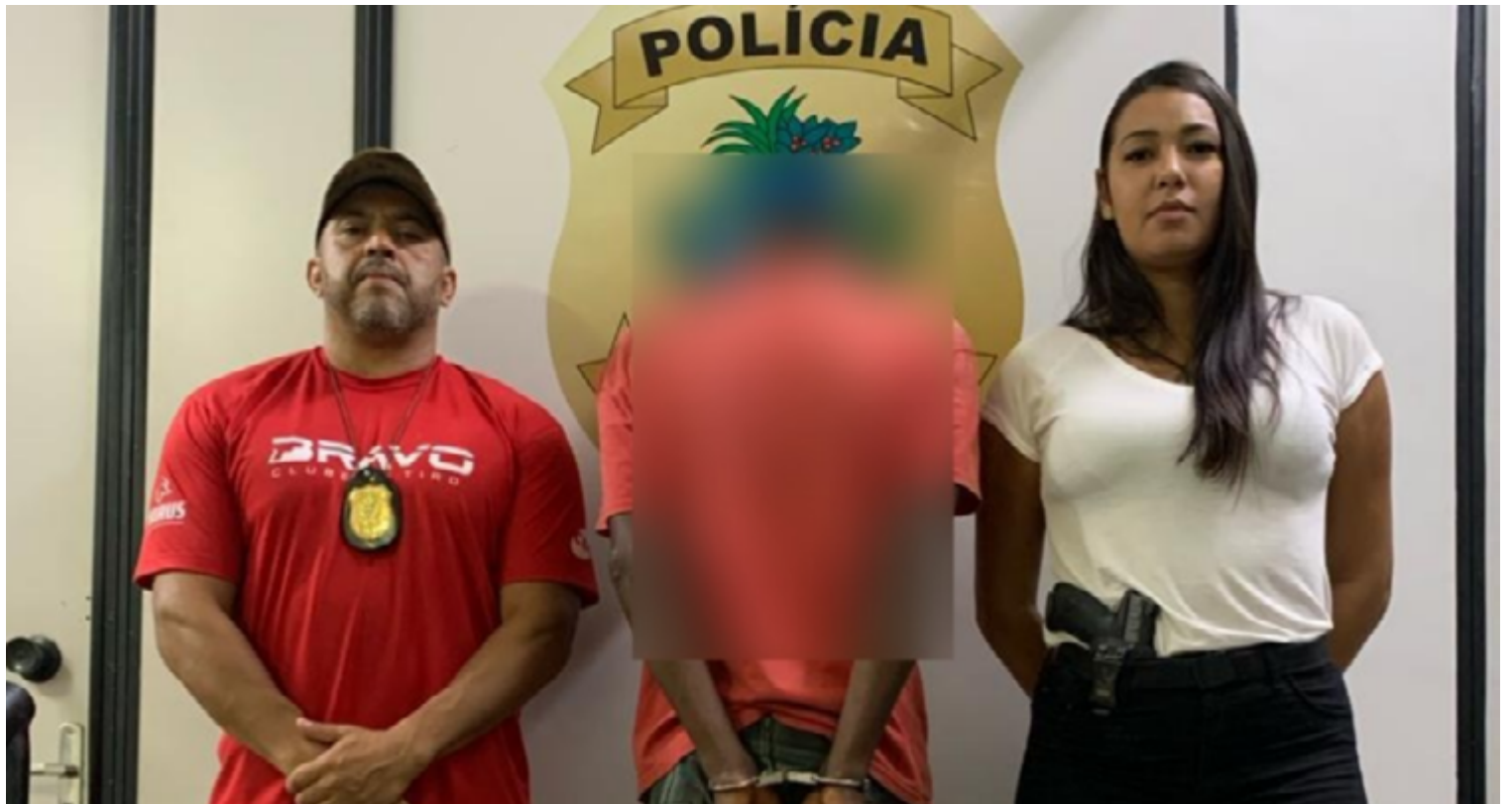
A Polícia Civil de Goiás (PCGO) agiu rapidamente após o registro do caso, localizando e prendendo o agressor em flagrante

A Polícia Civil de Goiás (PCGO) agiu rapidamente após o registro do caso, locali-