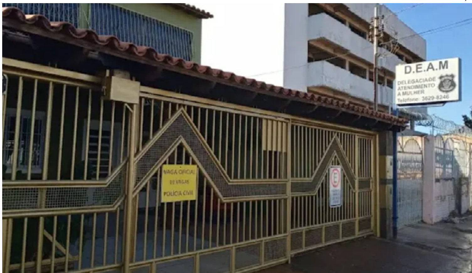
O caso revela mais uma vez a importância de denunciar e combater ativamente casos de abuso sexual, especialmente envolvendo crianças

Diante das evidências, a irmã mais velha apresentou o áudio à mãe da vítima, que prontamente buscou ajuda na delegacia. Solicitou medidas protetivas de urgência e, em um ato de coragem, decidiu sair de casa. O suspeito, ao tomar conhecimento de que estava sob investigação, inicialmente fugiu. No entanto, posteriormente, acabou se entregando às autoridades na de-