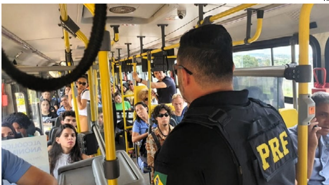
Essas ações educativas incluem palestras e distribuição de material informativo

Como parte da Política de Enfrentamento ao Assédio, recentemente lançada pela instituição, a operação busca sensibilizar condutores e passageiros por meio de abordagens em veículos de transporte coletivo. Essas ações educativas incluem palestras e distribuição de material informativo, que esclarecem as definições legais do crime, as penalidades previstas e os ca-