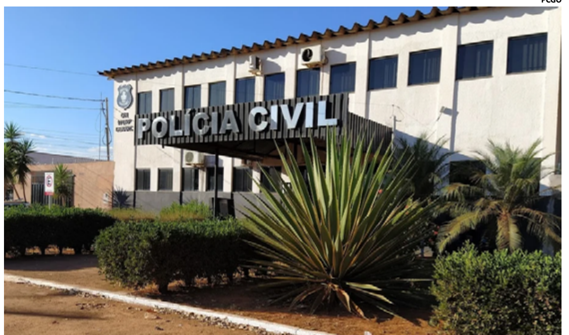
A prisão representa um passo importante na garantia da segurança digital e no combate à extorsão online

A operação contou com o apoio da Unidade de Inteligência da 11ª DRP, demonstrando o comprometimento das autoridades policiais em combater crimes virtuais e proteger a população contra esse tipo de conduta criminosa. A prisão do suspeito representa um passo importante na garantia da segurança digital e no combate à extorsão online.