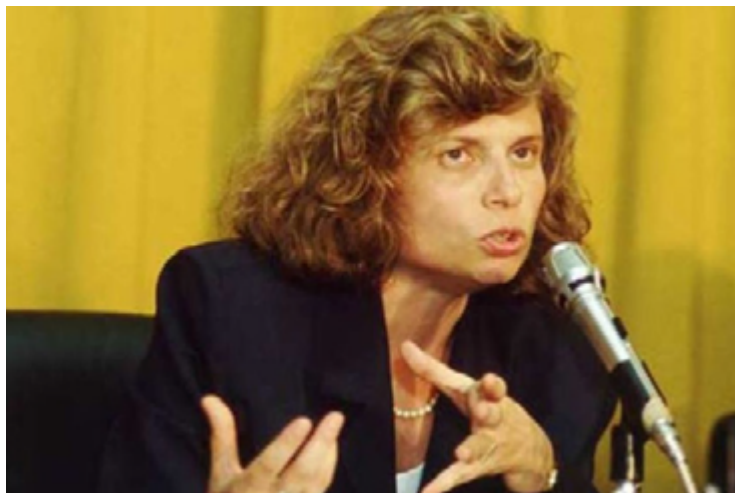
Zélia Cardoso de Mello: ministra da Economia no governo Fernand Collor

A pesquisadora coletou no portal da Presidência da República registros de quem foi nomeado e exonerado. Depois, confirmou as informações no Diário Oficial. Quem ocupou