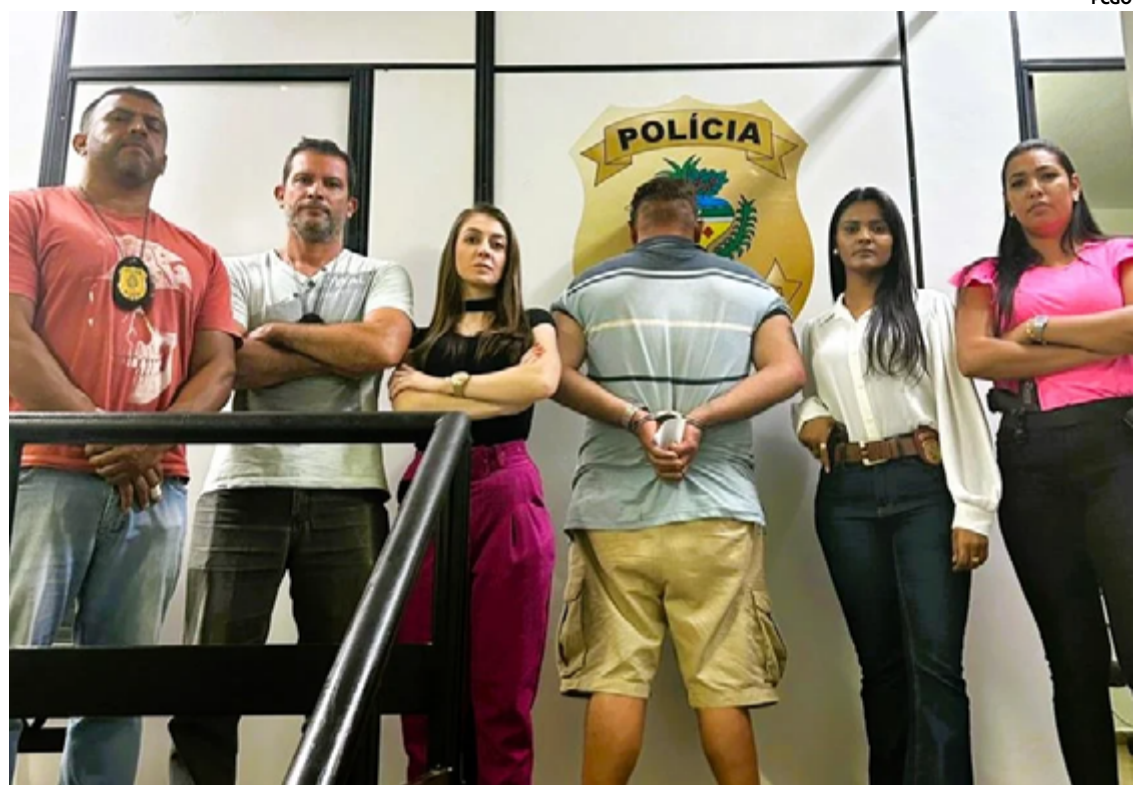
Entre os crimes imputados estão cárcere privado, racismo, violência psicológica, posse ilegal de arma de fogo

Como resultado, o homem foi preso e encaminhado para a Unidade Prisional de Planaltina de Goiás, onde aguardará os desdobramentos legais de suas ações. A comunidade local espera que a justiça seja feita e que medidas eficazes sejam tomadas para proteger a vítima e prevenir futuros casos de violência doméstica.