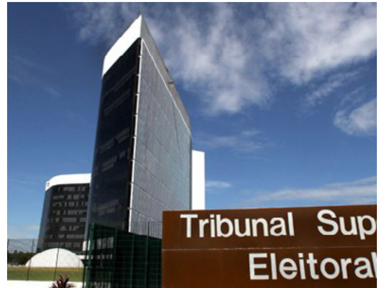
Alexandre de Moraes, presidente do TSE, será responsável pelo CIEDDE