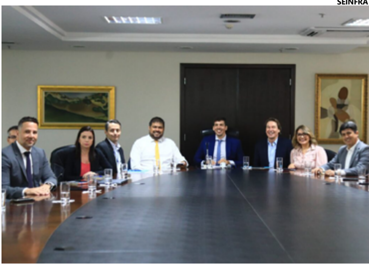
Mais um passo rumo à universalização do saneamento básico em Goiás foi dado nesta terça-feira (12/03)