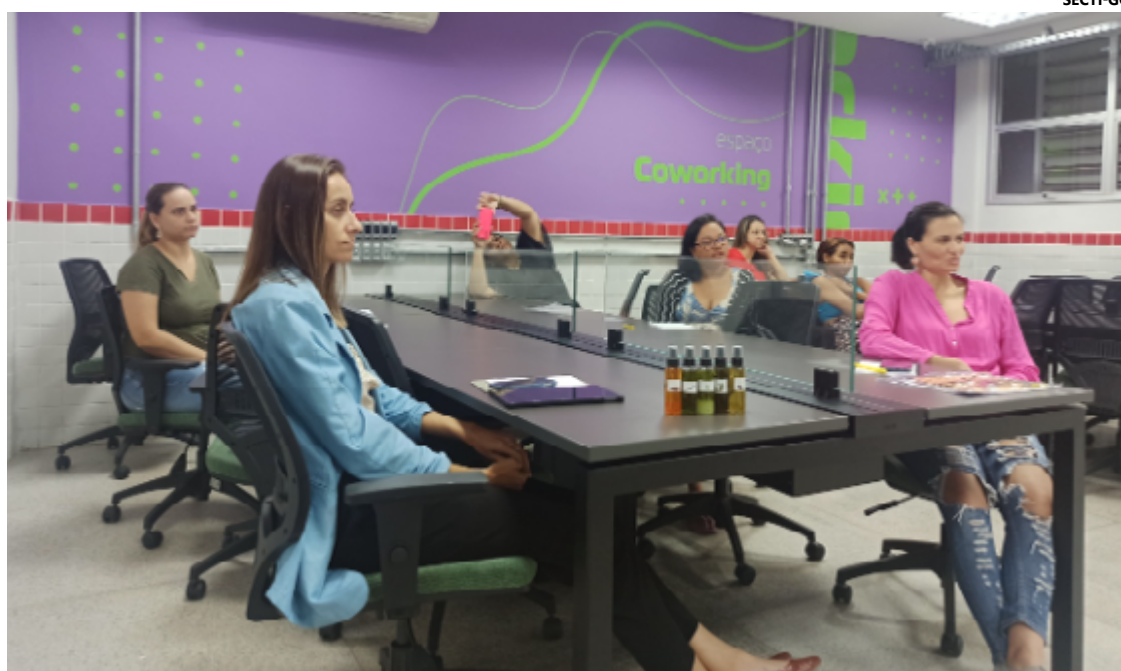
Mulheres goianas recebem consultoria do Governo de Goiás para abrir negócios de sucesso

Os projetos selecionados contarão com suporte, desde a concepção até a consolidação dos negócios. As participantes utilizam espaços das EFGs, como o InoveLab, um laboratório de