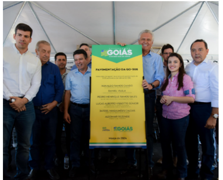
Governador Ronaldo Caiado realiza entregas em Mineiros: “Estamos integrando uma das regiões mais produtivas do Estado”

Prefeito de Mineiros, Aleomar Rezende disse que as obras eram aguardadas há 50 anos pelos produtores locais. “O governador veio aqui há dois anos e lançou a obra. Agora concluiu. Tudo que Caiado tem feito é de alto padrão, a exemplo dessa estrada”, comentou ele, acrescentando que “o que Mineiros precisava, o governador já fez ou está fazendo”.